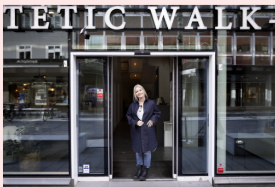
Umeåkliniken ligger mitt i centrum, vid Utopia.

Det finns en debatt om skönhetsbranschen och omöjliga utseendekrav. Märker ni av någon kritik?